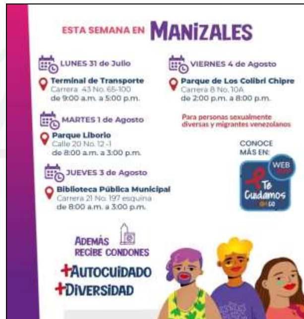
Imagen 9: información compartida en el chat de Asociación de usuarios. Fecha 31/07/2023