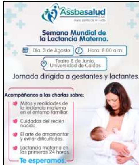
Imagen 8: información compartida en el chat de Asociación de usuarios. Fecha 28/07/2023