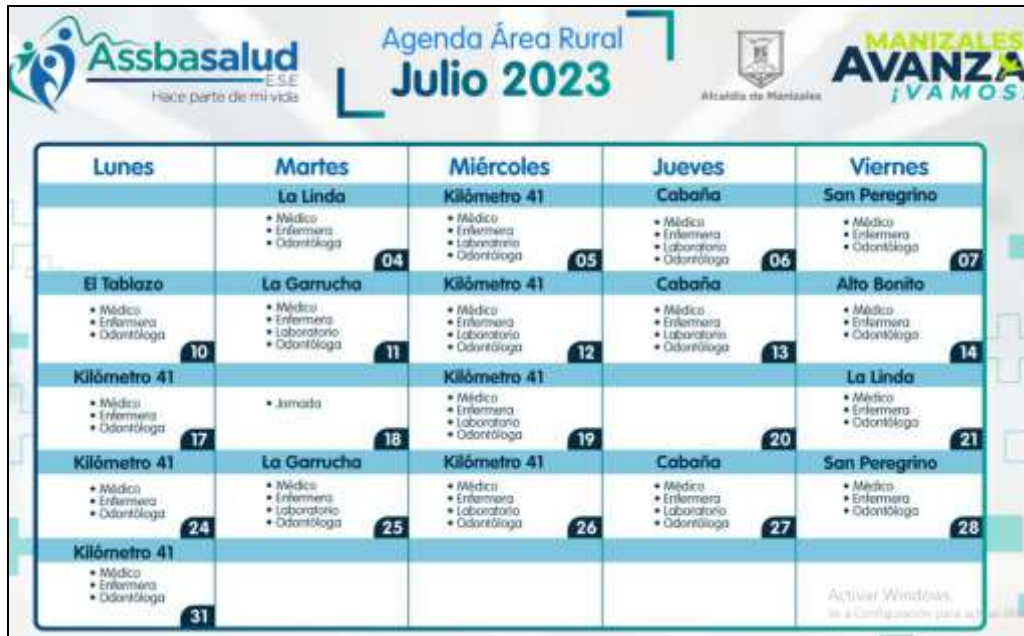
Imagen 4: información compartida en el chat de Asociación de usuarios. Fecha 12/07/2023