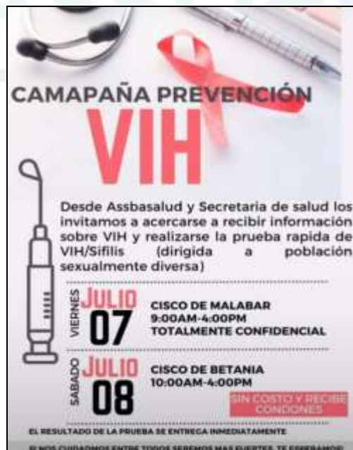
Imagen 1: información compartida en el chat de Asociación de usuarios. Fecha 10/07/2023