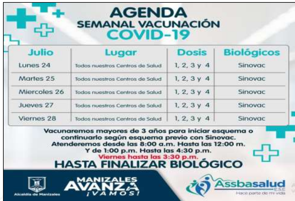
Imagen 6: información compartida en el chat de Asociación de usuarios. Fecha 24/07/2023