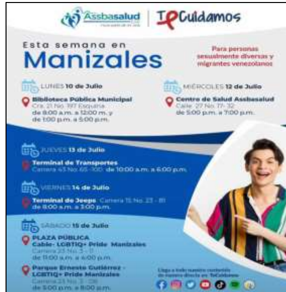
Imagen 2: información compartida en el chat de Asociación de usuarios. Fecha 10/07/2023