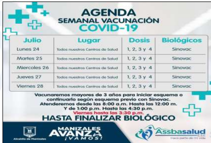
Imagen 3: información compartida en el chat de Asociación de usuarios. Fecha 10/07/2023