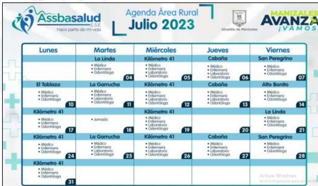
Imagen 5: información compartida en el chat de Asociación de usuarios. Fecha 17/07/2023